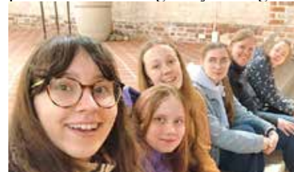
Sammen med venner i Estland

I påsken foregikk det som vanlig mye i kirken. Her er imidlertid ikke påsken en ferie. Langfredag er den eneste fridagen de har. Gudstjenesten på skjærtorsdag holdes derfor på kveldstid. Fredag morgen ble det holdt gudstjeneste og første påskedag var det gudstjeneste med fullt opplegg. På gudstjenesten sang misjonskoret, og ungdommene framførte en dans som de hadde jobbet med. I tillegg fikk jeg sammen med alle ungdommene være med i prosjonen og plassere alt tilbake på alteret. En veldig vellykket og bra